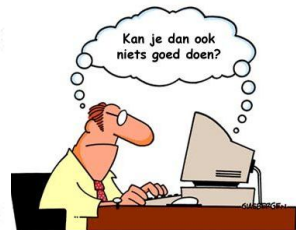
Ambtenaren op zoek naar oplossingen