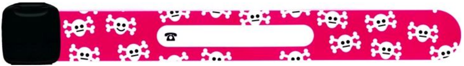
Een roze polsbandje. Niet van Ecosy, wel heel gezellig.

Toen we 's avonds aankwamen in Passau, zijn we deze mooie stad gaan bekijken. Daarna hebben we een leuk eettentje opgezocht om het begin van de vakantie te vieren. Om 23:30 uur zijn we terug gegaan naar ons hotel. Daar ploften we neer op onze bedden, want de vermoeidheid had wel wat toegeslagen. Gelukkig was de ligging zeer rustig en waren de slaappleatsen comfortabel. De volgende dag zijn we om 9:00 uur opgestaan. Met een goed ontbijt vertrokken we naar het Balatonmeer. Omdat de delegatie nog wat minder ver was, zijn we in de middag nog wat uitvoeriger gaan eten om uiteindelijk rond 17:00 uur aan te komen op de plaats van bestemming.