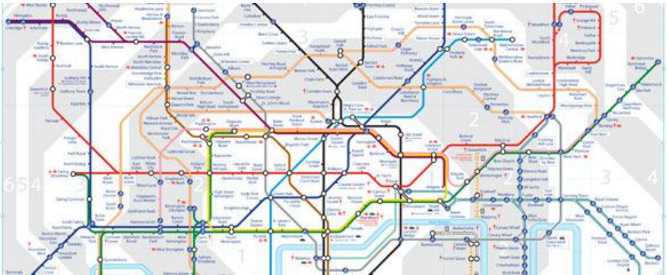
Deel van de metrokaart van Londen