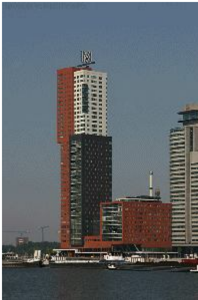
De Montevideotoren op de Kop van Zuid.....