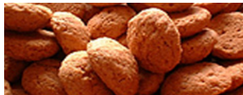
...en dit zijn kruidnootjes!