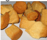
Dit zijn dus pepernoten...