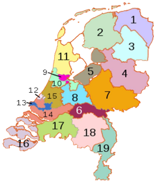
Nederland in districten?

Om een systeem van twee partijen af te dwingen, is het mogelijk om een districtenstelsel in te voeren. Hierbij wordt het land in 150 kiesdistricten opgedeeld. De kandidaat met de meeste stemmen in het district, wint de zetel. In de praktijk hou je dan maar twee partijen over die serieus kunnen regeren, omdat bijna altijd één partij de absolute meerderheid van het aantal zetels haalt. Dit is wat in bijvoorbeeld Groot-Brittannië al honderden jaren in de praktijk wordt gebracht. D66 maakt zich sinds haar oprichting hard voor een soort districtenstelsel. Opmerkelijk, want hierbij zou deze partij waarschijnlijk niet meer bestaan. Het gevaar hierbij is dat alle partijen naar het midden toe trekken en er een eenheidsworst ontstaat, waarbij de partijen alleen nog maar op nuances van elkaar verschillen. Dit hoeft niet zo te zijn (de Amerikaanse Democraten zijn politiek gezien redelijk ver verwijderd van de Republikeinen), maar kan een uitkomst van zo'n systeem zijn. Een ander probleem van zo een systeem is dat je voor de invoering een grondwetsverandering nodig hebt, wat het idee bij voorbaat al haast kansloos maakt. Hiervoor is namelijk een tweederde meerderheid nodig. Bovendien moeten twee periodes van het parlement ermee instemmen. Aangezien het niet voor de hand ligt dat tweederde van het huidige politieke bestel zich in een grondwetswijziging kan vinden, zal het praktisch onmogelijk worden om die te bereiken.