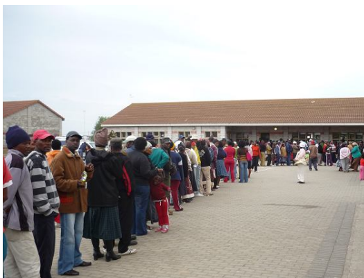
Mensen in de rij voor het stemlokaal